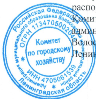
СХЕМА ВОДОСНАБЖЕНИЯ И ВОДООТВЕДЕНИЯ ВОЛОСОВСКОГО ГОРОДСКОГО ПОСЕЛЕНИЯ ВОЛОСОВСКОГО РАЙОНА ЛЕНИНГРАДСКОЙ ОБЛАСТИ

Утверждена распоряжением Председателя Комитета по городскому хозяйству Администрации муниципального образования Волосовский муниципальный район Ленинградской области